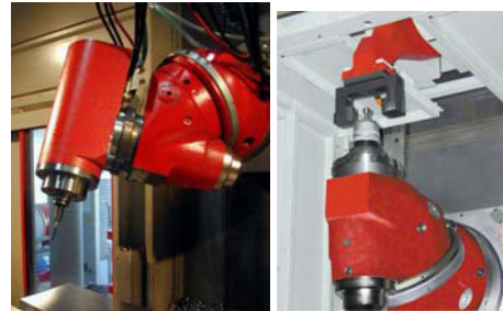
TBA4 avec ELBR DMDU